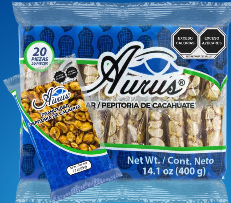
VERDE 20 GR / 30 BLS / 20 PZAS