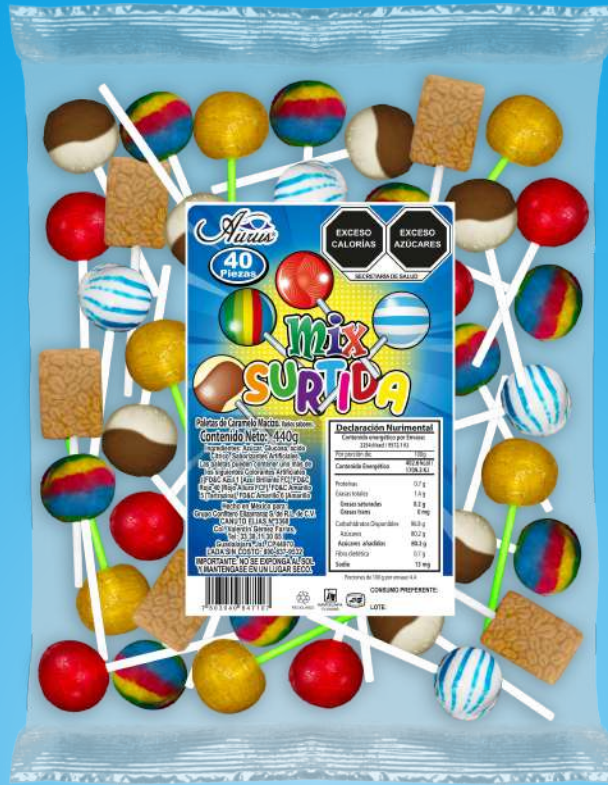
MIX SURTIDA 35 BLS / 40 PZAS / 440 GR