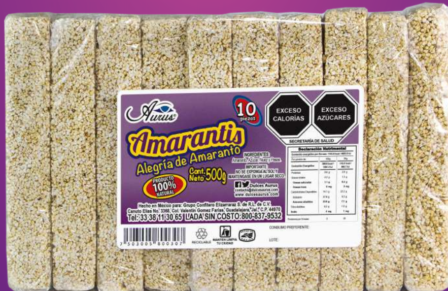
ALEGRÍA GRANDE 20 BLS / 10 PZAS / 50 GR