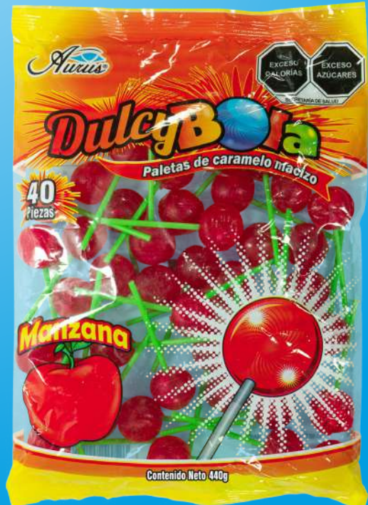
MANZANA 35 BLS / 40 PZAS / 11 GR