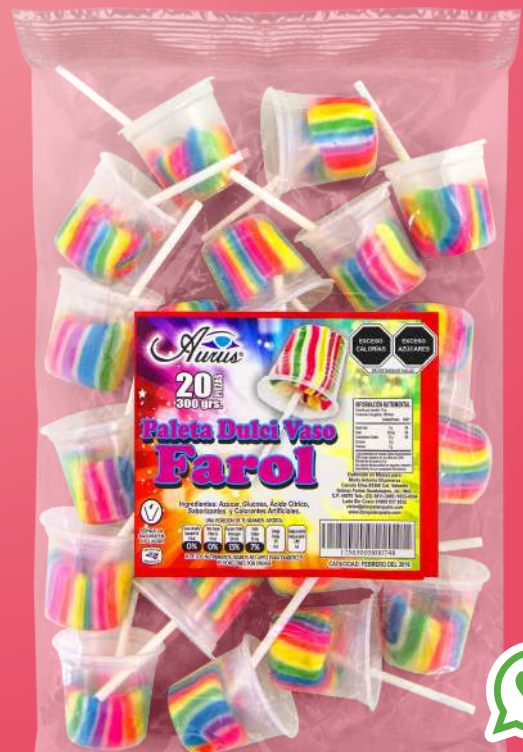
VASO FAROL 30 BLS / 20 PZAS / 12.5 GR