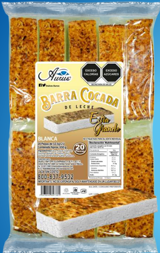
EX GRANDE 20 BLS / 24 PZAS / 32.5 GR