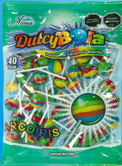
ARCOIRIS 35 BLS / 40 PZAS / 11 GR