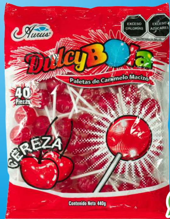
CEREZA 35 BLS / 40 PZAS / 11 GR