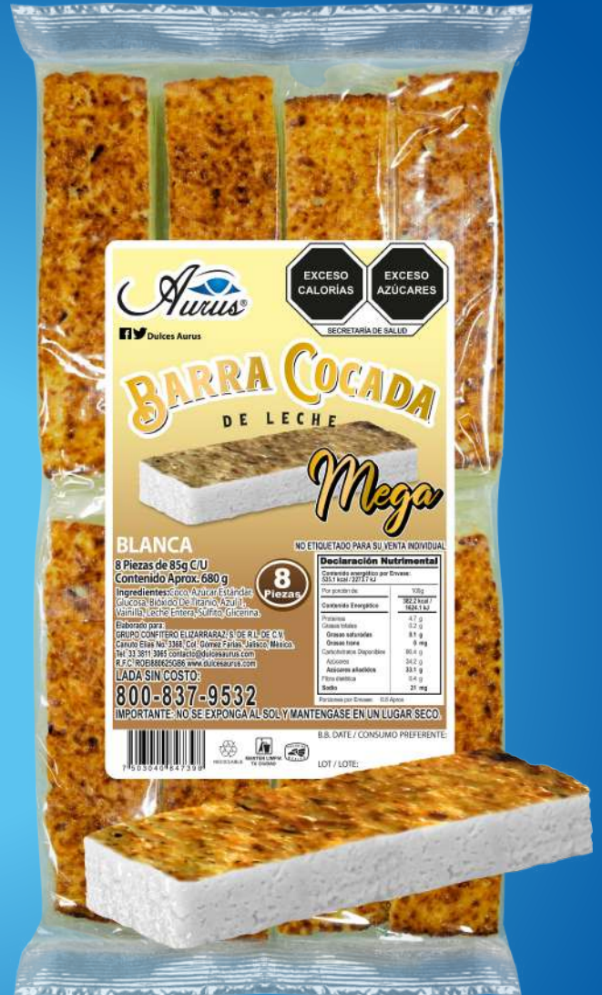
MEGA 22 BLS / 8 PZAS / 85 GR