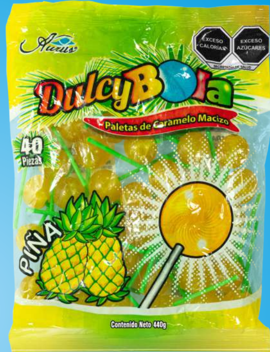
PIÑA 35 BLS / 40 PZAS / 11 GR