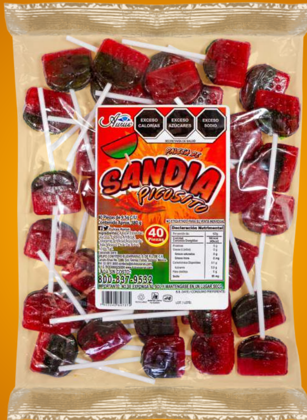
SANDIA PICOSITO 35 BLS /40 PZAS /9.5 GR