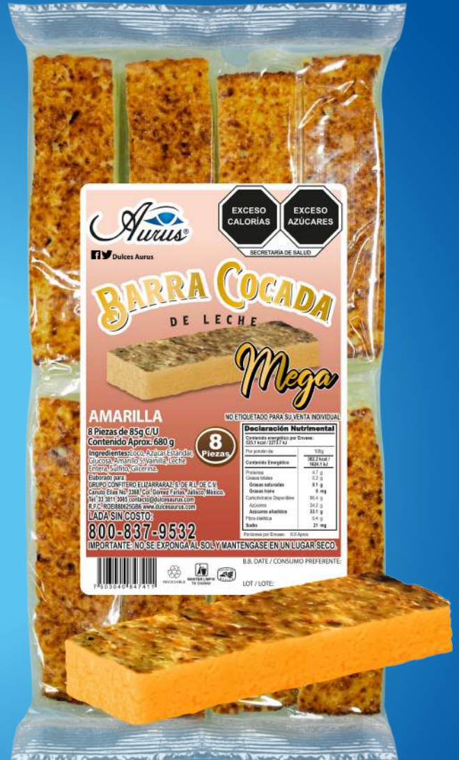
MEGA 22 BLS / 8 PZAS / 85 GR