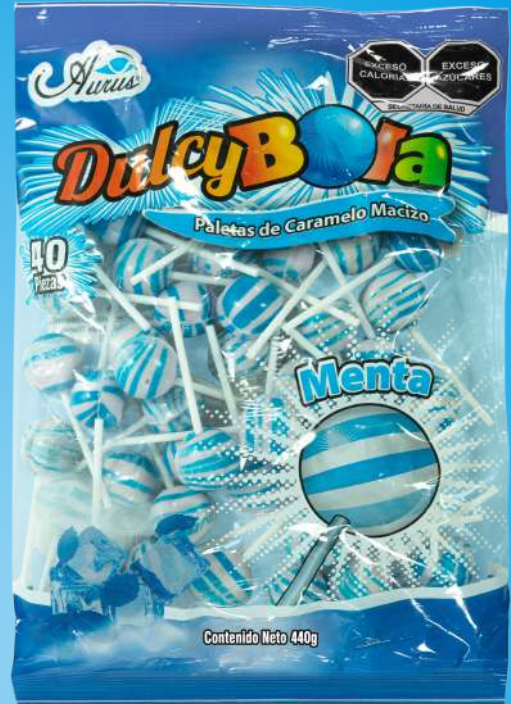
MENTA 35 BLS / 40 PZAS / 11 GR