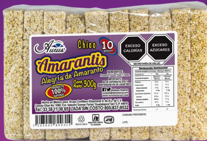
ALEGRÍA CHICA 32 BLS / 10 PZAS / 30 GR