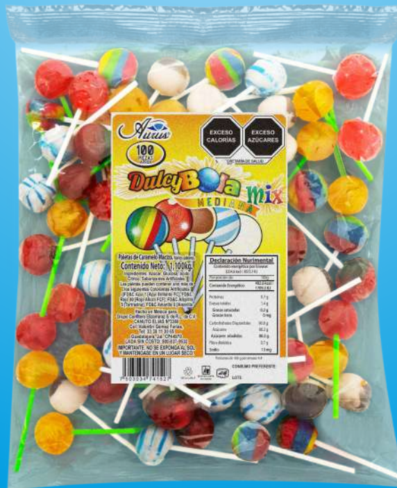
MIX DULCY BOLA 16 BLS X CAJA / 100 PZAS / 1,100 KG