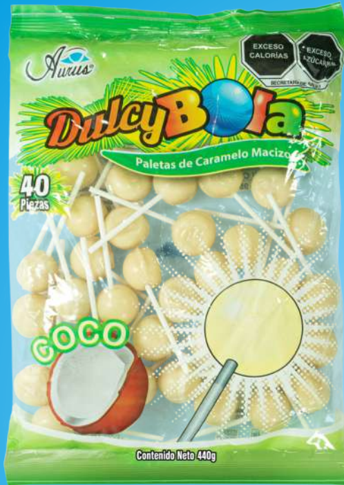
COCO 35 BLS / 40 PZAS / 11 GR