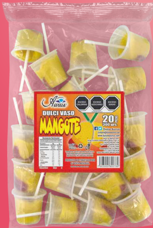
VASO MANGONEADA 30 BLS / 20 PZAS / 12.5 GR