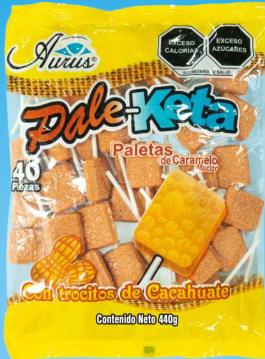
PALE-KETA 35 BLS / 40 PZAS / 11 GR