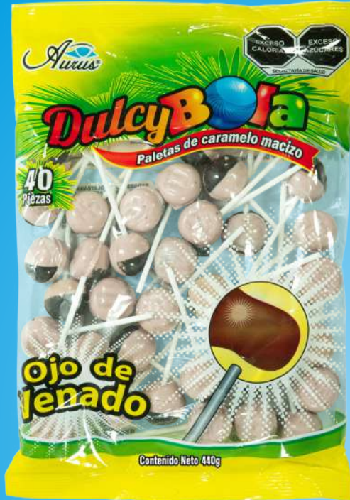
OJO DE VENADO 35 BLS / 40 PZAS / 11 GR