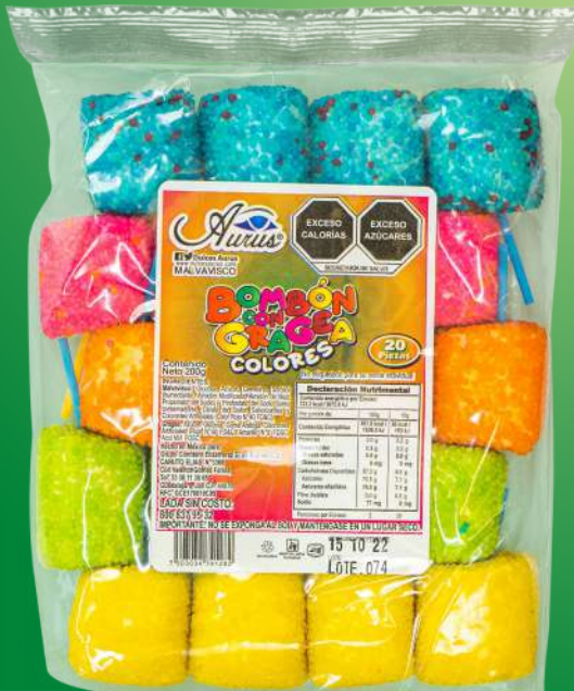
BOMBON COLORES 10 GR / 40 BLS / 20 PZAS