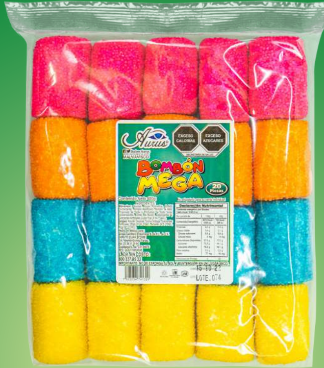
BOMBON MEGA 20 GR / 20 BLS / 20 PZAS