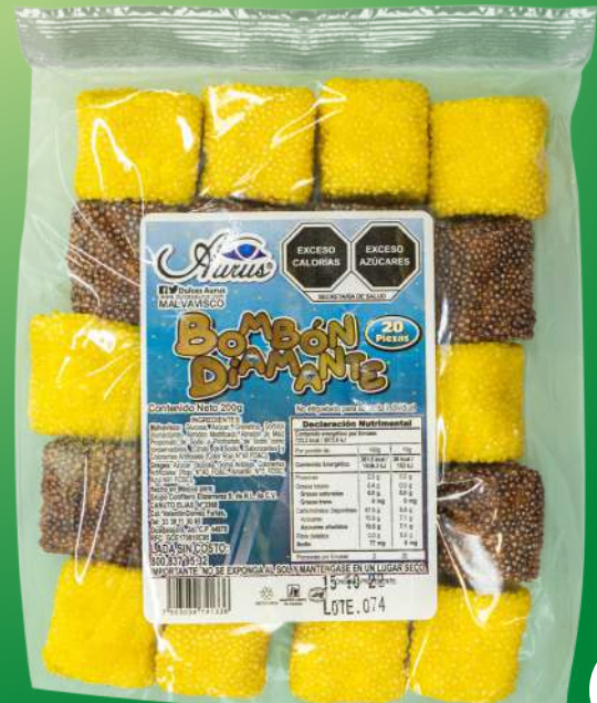
BOMBON DIAMANTE 10 GR / 40 BLS / 20 PZAS