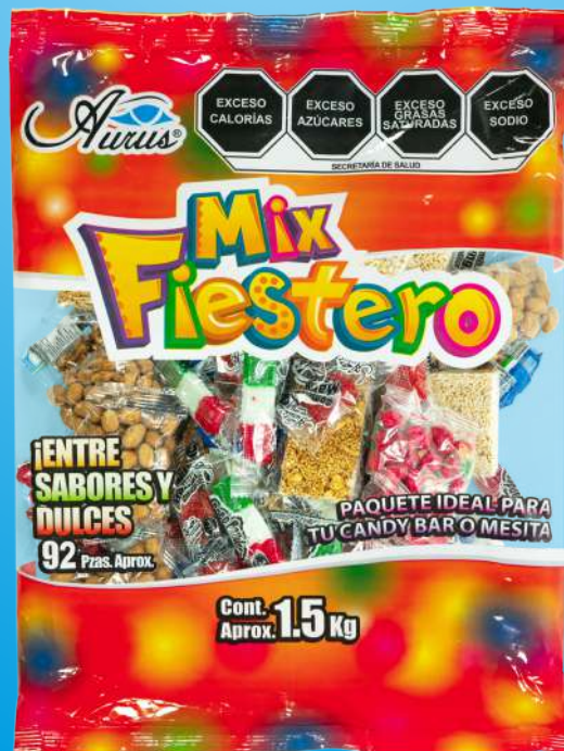
MIX FIESTERO 8 BLS / 95 PZAS / 1.5 KG