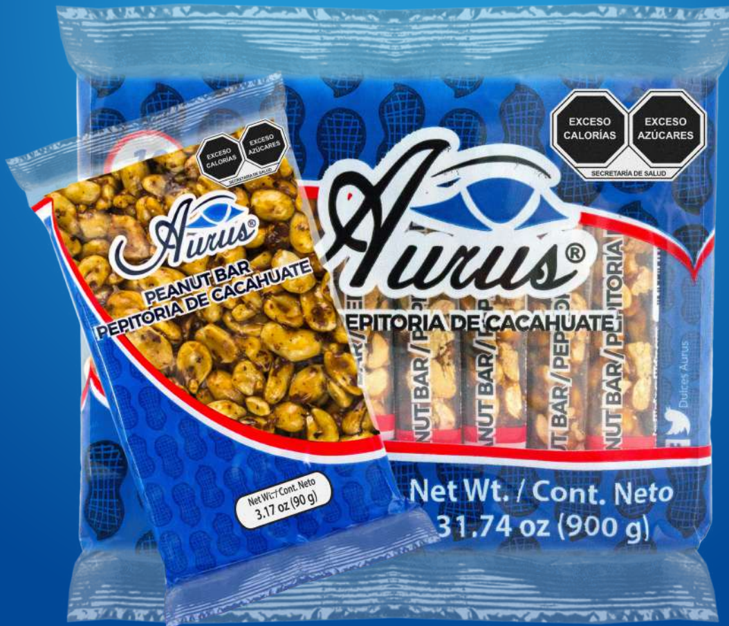
ROJA 90 GR / 20 BLS / 10 PZAS