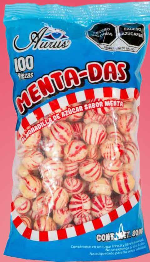
MENTA-DAS 40 BLS / 100 PZAS / 800 GR