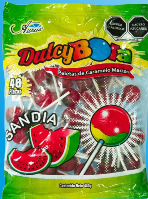
SANDIA 35 BLS / 40 PZAS / 11 GR